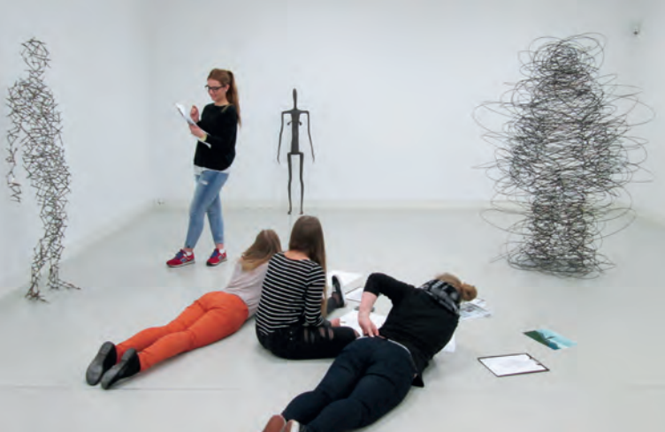
Raumansicht mit Werken von Antony Gormley