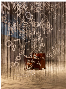
Chiharu Shiota Silent Word, 2022, SCHAUWERK Sindelfingen, 2022/2023