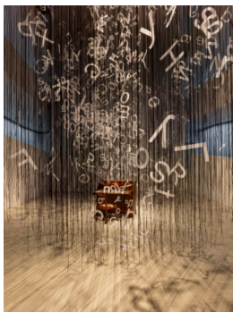
Chiharu Shiota Silent Word, 2022, SCHAUWERK Sindelfingen, 2022/2023, © Chiharu Shiota, VG Bild-Kunst, Bonn 2022